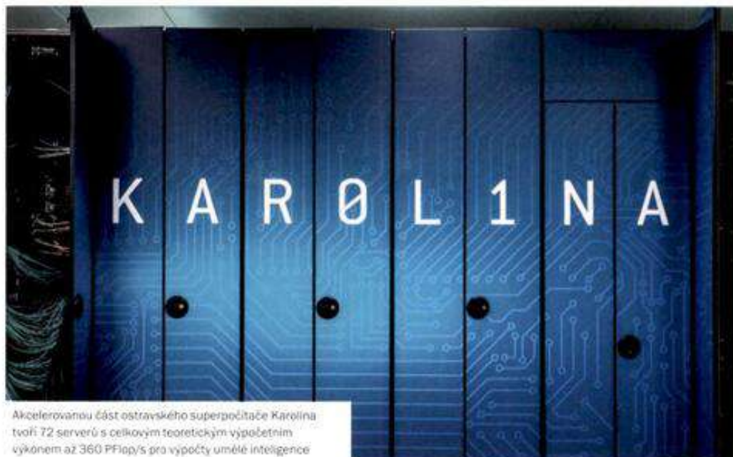
Akcelerační část ostravského superpočítače Karolina tvoří 72 serverů s celkovým teoretickým výpočetním výkonem až 360 PFlop/s pro výpočty umělé inteligence

K dispozici jsou i specializované superpočítače, které jsou vhodné jen pro určitý typ úloh, v datacentru nechybí Nvidia DGX-2, platformy od Fujitsu (A64FX s HBM2), akcelerační platformy s programovatelnými kartami Intel Stratix 10 (FPGA) nebo řešení od AMD v podobě Xilinx Alveo se staršími výpočetními kartami MI100. V poslední době se trh také přiklání