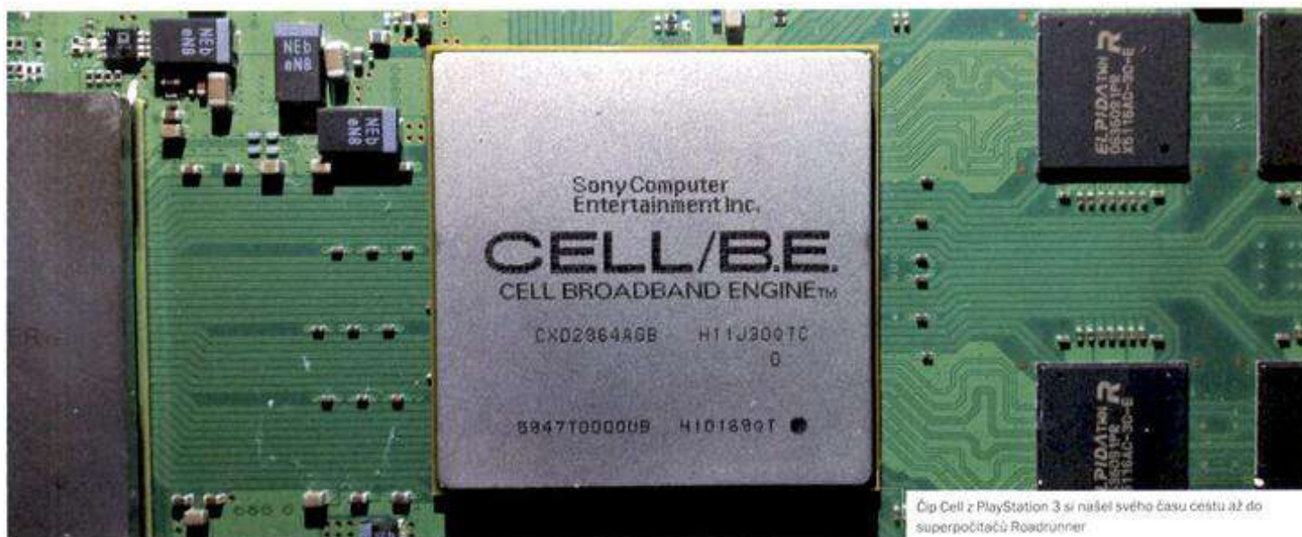
Čip Cell z PlayStation 3 si našel svého času cestu až do superpočítačů Roadrunner

extrémně velké množství dat a extrémně vysoký výpočetní výkon. Právě trénink nového modelu umělé inteligence a jeho náročnost je důvod, proč se Nvidia tak raketově stala nejhodnotnější společností na světě. Její výpočetní grafické karty a rozšířená softwarová podpora pro masivní zpracování dat totiž umožňují provádět trénování i těch největších modelů, které jsou aktuálně na světě k dispozici.