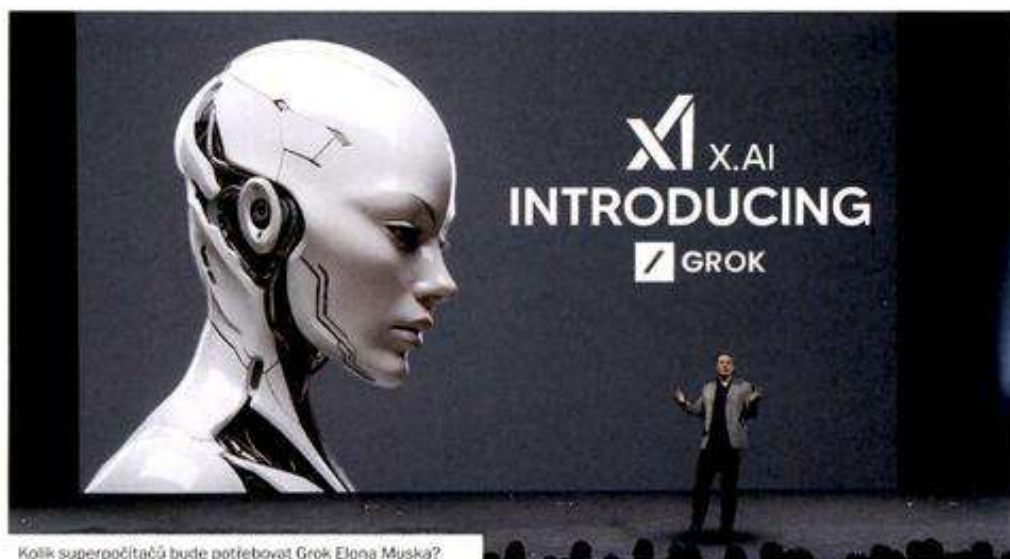
Kolik superpočítačů bude potřebovat Grok Elona Muska?

Škoda Auto od té doby několikrát modernizovala. V nejnovějším případě má nový superpočítač HPE SGI 8600 s původním výkonem 2 PFLOPS (petaflops, tedy 10 15