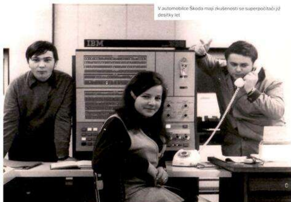
V automobilce Škoda mají zkušenosti se superpočítači již desítky let

K dosažení revolučního stupně inteligence, kterou přinesl model GPT od OpenAI, bylo zapotřebí nejen nových algoritmů, ale především